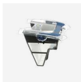
Bac filtrant (3L)